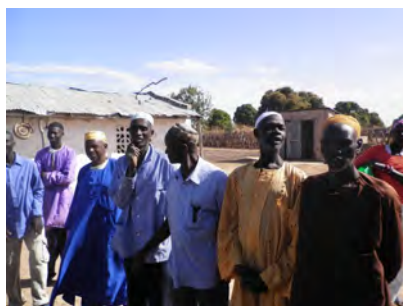
学校教員のみなさん