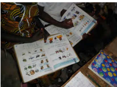
使用している英語の教科書