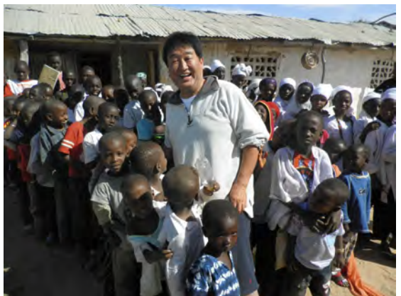
児童生徒たちと一緒に