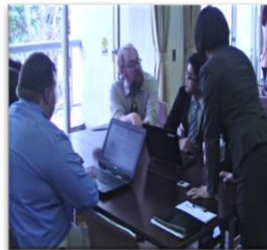
デジタル教材 活用方法