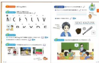
Junior Sunshine 5 p.8-9