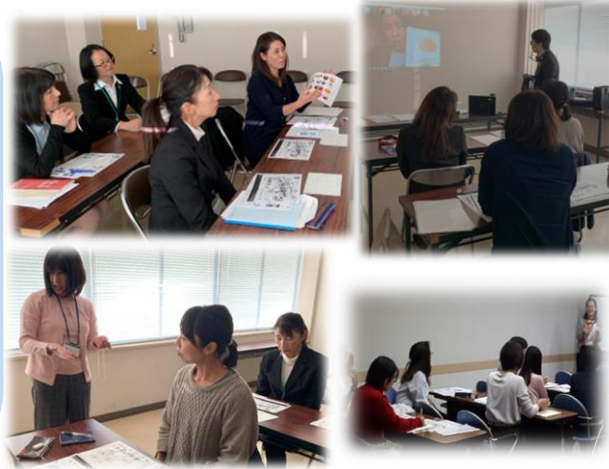
▲アクティビティ考案ワークショップの様子